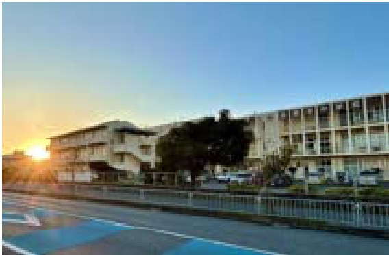
《与那原中学校に昇る朝日 1月5日:撮影》

明けましておめでとうございます。令和8年2026年がスタートしました。今年の干支は「丙午ひのえうま」。太陽のような強いエネルギーと、馬の躍動感を象徴する、前進の年です。