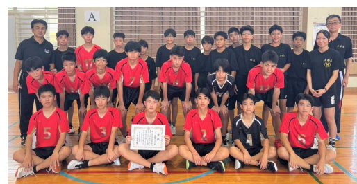
三位 男子バレー部