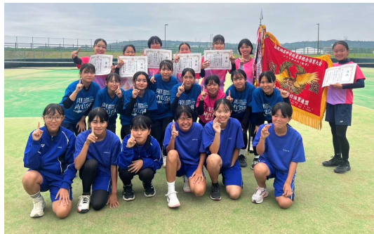
《優勝 女子ソフトテニス部》